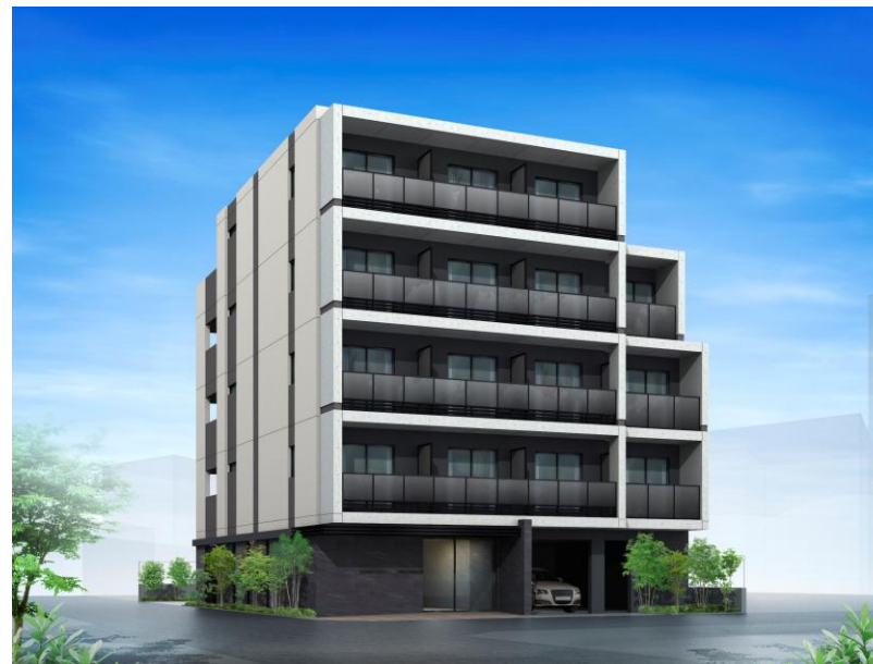
第3号開発案件（杉並区）