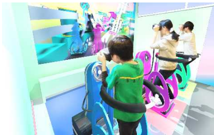
紙の裁断工程 イメージ

キャンパスチャレンジは、最先端のVRを活用し、製紙工場にいるような没入感を感じられる演出を導入します。