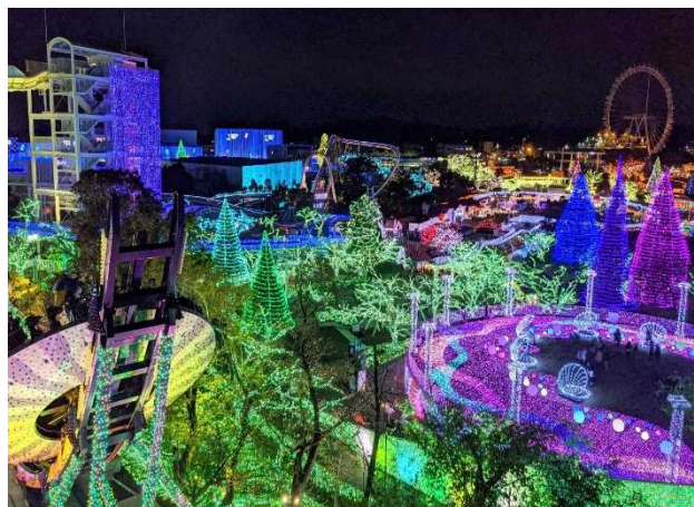
ジュエルミネーション全景