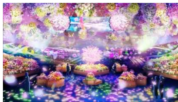
花とデジタルアートの コラボレーション イメージ

常設施設として日本初！温室が暗転し、プロジェクションマッピングが始まると、花とデジタルアートの世界に変身し、驚き溢れる世界が広がります。