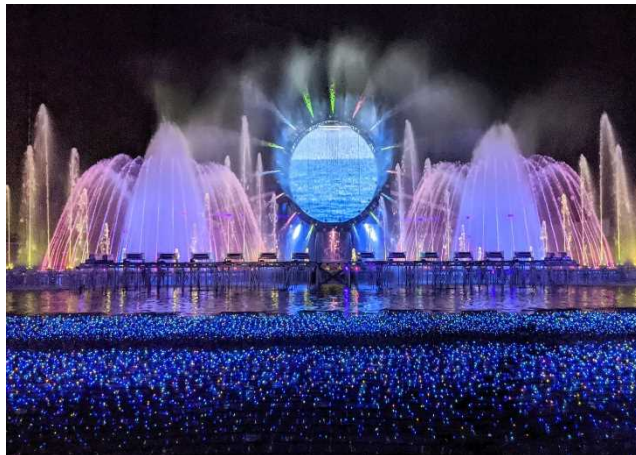
大迫力噴水ショー