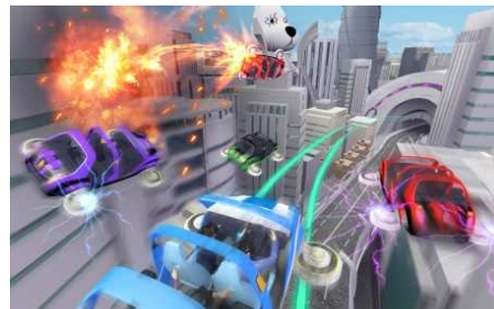
未来コース VR シーン イメージ

カスタムガレージは、VRゴーグルをかぶり、タイムマシンで過去や未来の世界でテスト走行ができるようになります。