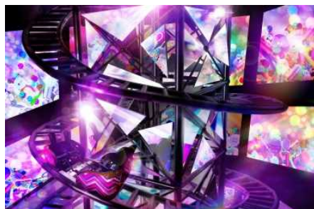
スパイラルリフト演出 イメージ

SNS映えを意識し、キューラインやコース内を、光・音・映像で没入感を演出します。日本初!?アトラクションに乗りながらスマートフォンでの撮影が可能になります。