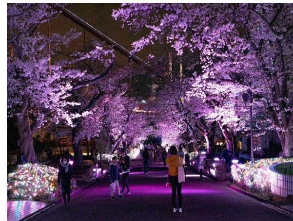
桜並木ライトアップ 昨年の様子

公式サイト https://www.yomiuriland.com/jewellumination/