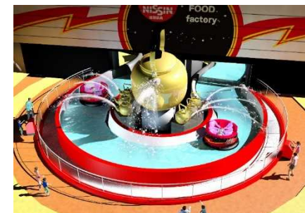
ケトラーいたずらショット盤 イメージ

日清焼そば U.F.O. のキャラクター「ケトラー」によるいたずらやお客様が水を発射するやかんポイントなど、乗車中息つく暇がないほどに演出が楽しめます!