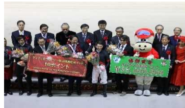
昨年の表彰式の様子

2歳馬のダートNo.1決定戦。昨年から米国のG1「ケンタッキーダービー」の出走馬選定ポイントレースの一つに選ばれたことで注目度がアップ。