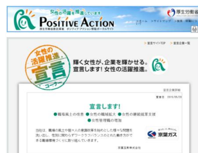
厚生労働省ポータルサイトへの掲載

※厚生労働省ポータルサイト URL http://www.positiveaction.jp/