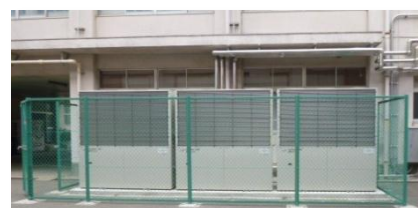
ガス空調機（GHP 室外機）

千葉県立高校 PTA 向けのガス空調サービスは、平成 18 年よりサービスを開始し、おかげさまで採用数が 22 校で冷房能力合計が約 1 万 kW になりました。今後も引き続き、ビジネスパートナーとともにお客さまに満足いただけるサービスを提供してまいります。