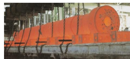
金属熱処理工程における天然ガス利用

産業用分野を中心に、重油等の石油系燃料から環境に優しい天然ガスへの燃料転換を積極的にご提案しております。燃料転換による CO 2 削減に加えて、省エネルギー提案等を行うことでお客さまとともに一層の CO 2 削減を行ってまいります。