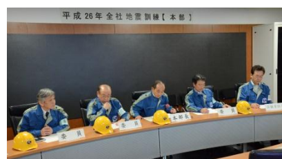
地震防災訓練の様子

中期経営計画（平成25年～平成27年）では、東日本大震災で大きい被害を受けた浦安市をはじめとした供給ネットワークの防災対策を進めてまいりました。今後も引き続き、防災対策の高度化に資する取り組みを積極的に行ってまいります。