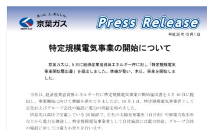
平成26年10月プレスリリース

当社は、平成26年10月より特定規模電気事業者として、自社施設およびグループ会社の施設に電力供給を行ってまいりました。今後、本格的な電力小売事業への参入に向けて準備を進めていく予定です。