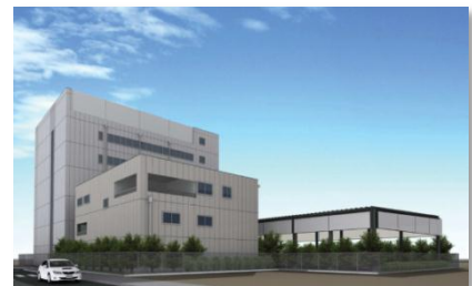
緊急保安研修施設完成イメージ

※緊急保安業務とは、ガスもれ等の緊急事態の際に、お客さまの安全を最優先に被害の拡大を防止するために行う業務です