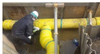
耐震性に優れたポリエチレン管への入替

古いガス導管の劣化等によるガス漏えいを予防するため、道路に埋設された導管の入替を進めています。今後も引き続き、計画的に古いガス導管の入替を行ってまいります。