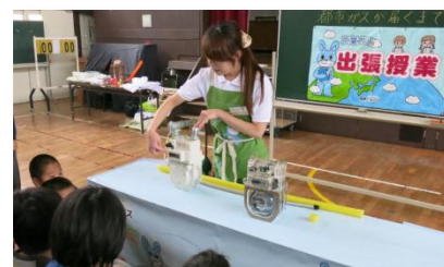
出張授業の様子（都市ガスが届くまで）

楽しく親しみやすい体験を通じて、子供たちに身近なところからエネルギーや環境問題への関心を持っていただき、ご家庭における取り組みのきっかけづくりになる活動を目的とした出張授業を行っています。