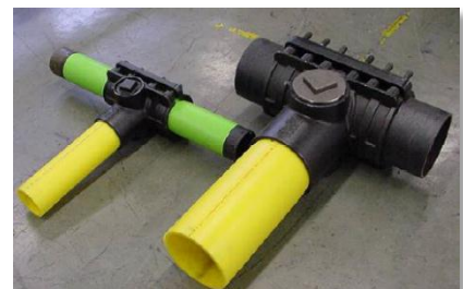
改良型ガス管分岐継手