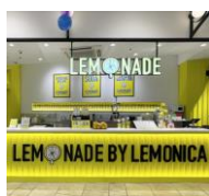
4. LEMONADE by Lemonica 大宮ラクーン