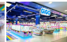
5. GiGO Vincom Plaza 3 Thang 2