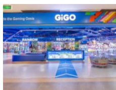
5. GiGO Vincom Mega Mall Grand Park