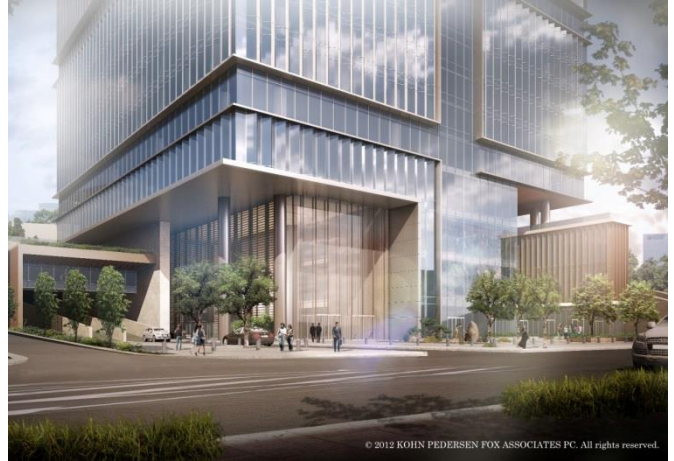
オフィス・ホテル棟 オフィスエントランス