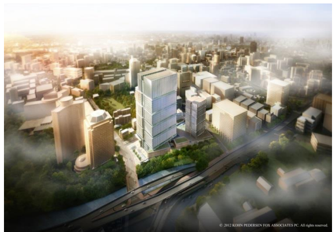
上空より本計画地を望む