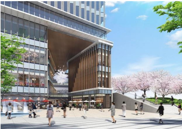
商業エントランス