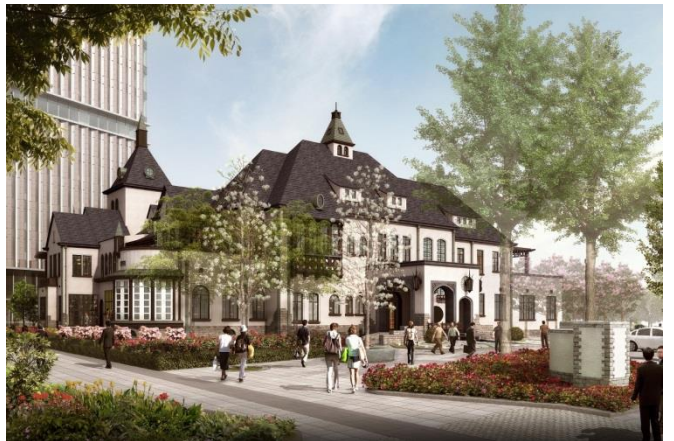
旧館保存イメージ