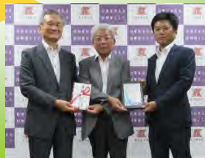
工業高等専門学校への寄付