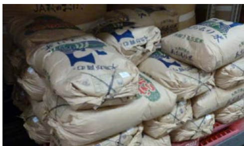
< ABL実績の事例 > 米