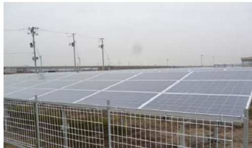
< ABL実績の事例 > 太陽光設備