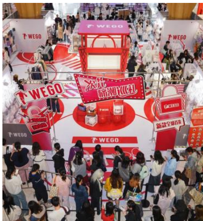
「上海静安大悦城」での ポップアップの様子