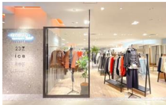
2024年10月2日オープンの大丸東京店OCS。 オープンから2ヵ月間の売上は、1.1億円超。