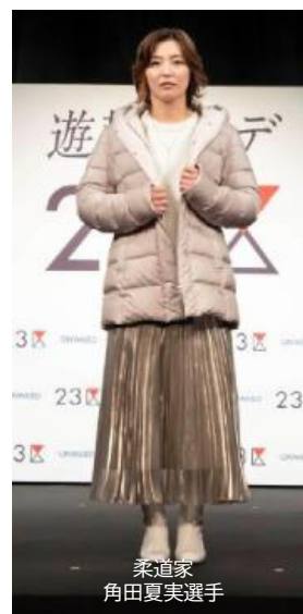
柔道家 角田夏実選手