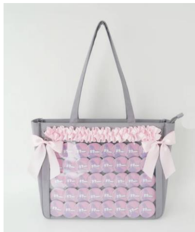
アニメやアイドルなどの缶バッジ等 を付けて推しへの愛を表現する 人気推し活グッズ「痛バッグ」