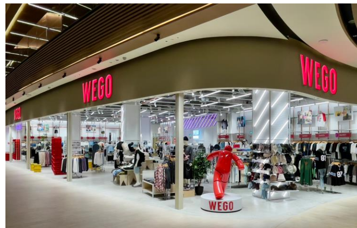
「ららぽーとBBCC(マレーシア)」の ウィゴー店舗外観