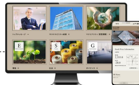
改修後の現コーポレートサイト