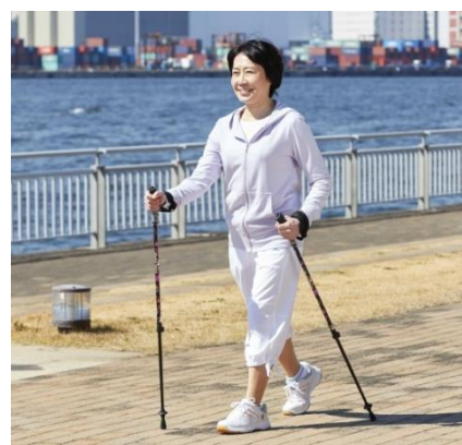
アドバンスポール ADVANCE POLE