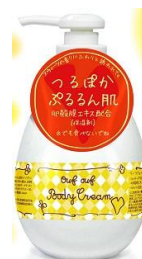
【リーフレッシュ ボディクリーム】