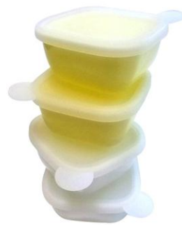
(S) サイズ：101×53×101 mm 容量：270ml