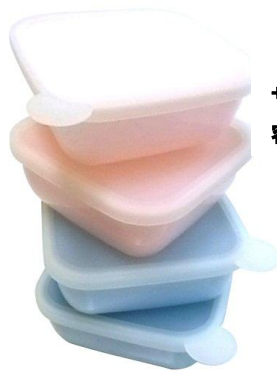
(M) サイズ：132×53×132 mm 容量：530ml