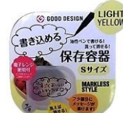
【書き込める保存容器（Sサイズ）】 ライトイエロー、ホワイトのカラーから4個 （カラーの選択は当社にお任せいただきます）