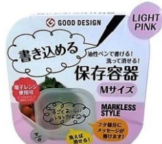
【書き込める保存容器（Mサイズ）】 ライトピンク、ライトブルーのカラーから4個