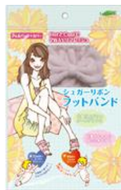
【シュガーリボン フットバンド】