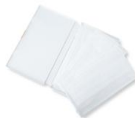
1週間分のマスクを収納 【抗菌マスクケース】 1個