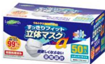
【すっきりフィット 立体マスク α99%（大人用）】 50枚入り2箱