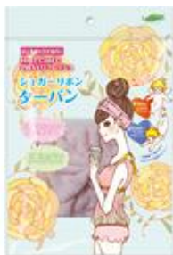
【シュガーリボン ターバン】