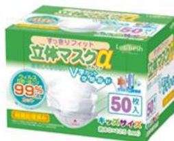
【すっきりフィット 立体マスク α99%（キッズ）】 50枚入り2箱