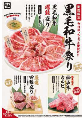
“ちょっと贅沢”な黒毛和牛堪能メニュー GW企画として3世代、連休中も頑張っている方へのご褒美

牛角のブランド力を活かし、家族連れ、会社員、若者など幅広い層のお客様へ牛角を訴求する施策を行った