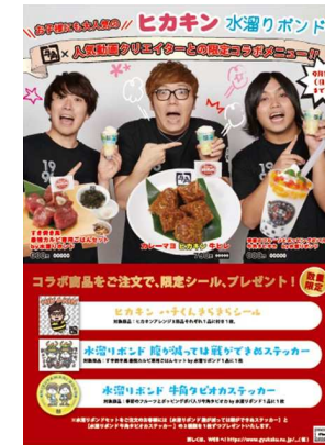
“夏のスタミナ牛角”人気動画クリエイターとコラボ YouTube等のサイトを視聴する若者への訴求