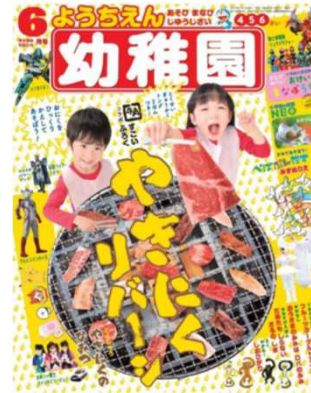
小学館“幼稚園”とコラボ 付録「やきにくリバーシ」 主に、小さいお子様がいらっしゃる家族向けへの訴求