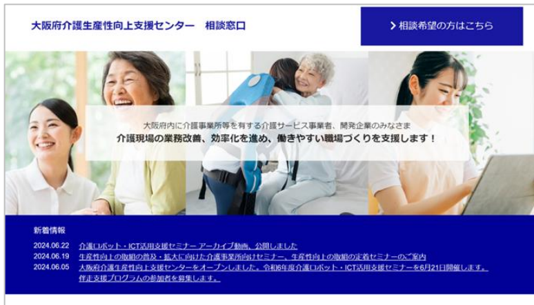
「大阪府介護生産性向上支援センター」WEBページより

※当センターは、介護現場の生産性向上や人材確保の取組みの推進を目的とした大阪府の介護生産性向上総合相談センター事業として、大阪府介護生産性向上総合相談センター事業共同企業体が受託し、当社が運営協力いたします。