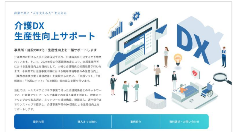
「介護DX生産性向上サポート」WEBページより

※当センターは、介護現場の生産性向上や人材確保の取組みの推進を目的とした大阪府の介護生産性向上総合相談センター事業として、大阪府介護生産性向上総合相談センター事業共同企業体が受託し、当社が運営協力いたします。