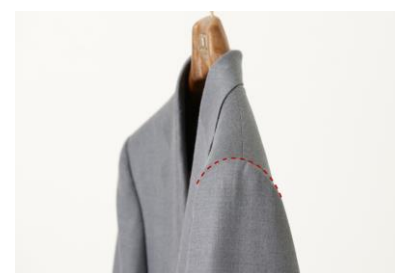
動きやすい袖イセ