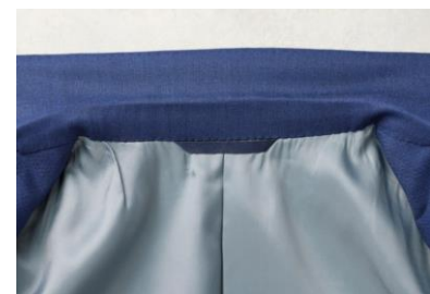
首にしっかり沿う一枚衿