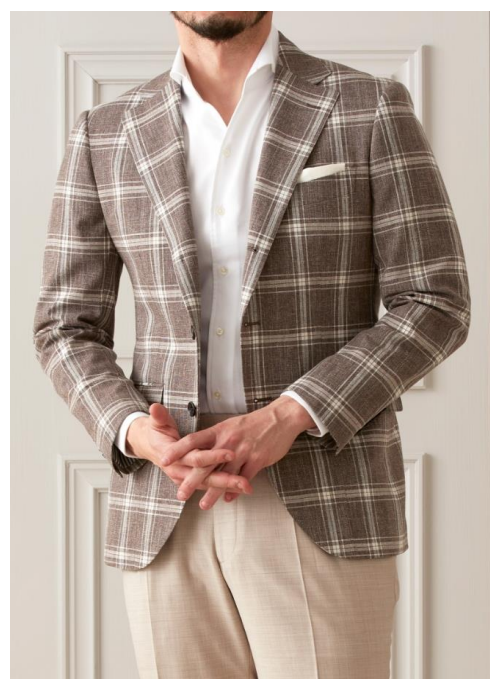
【カイザープレミアム レジェロ モデル】