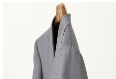
軽く柔らかい肩のライン