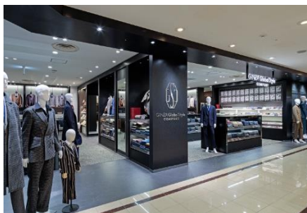
【ならファミリー近鉄奈良店】