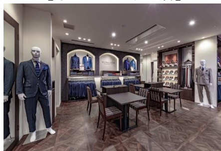
【なんばパークス店】