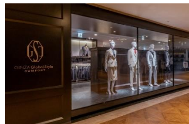
【セントシティ北九州店】