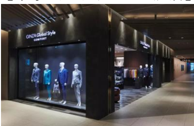
【東京ミッドタウン八重洲店】