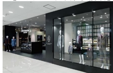
【ビックカメラ千葉駅前店】