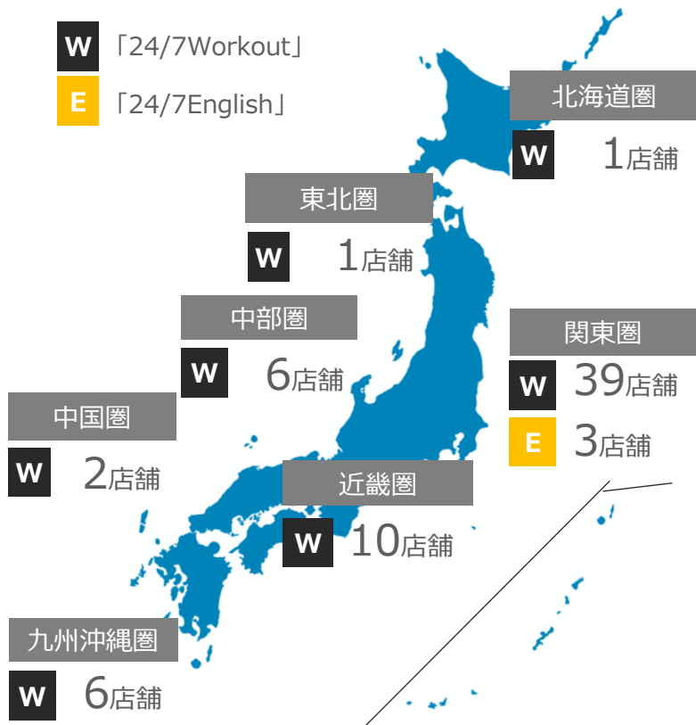
現在の地域別国内店舗網