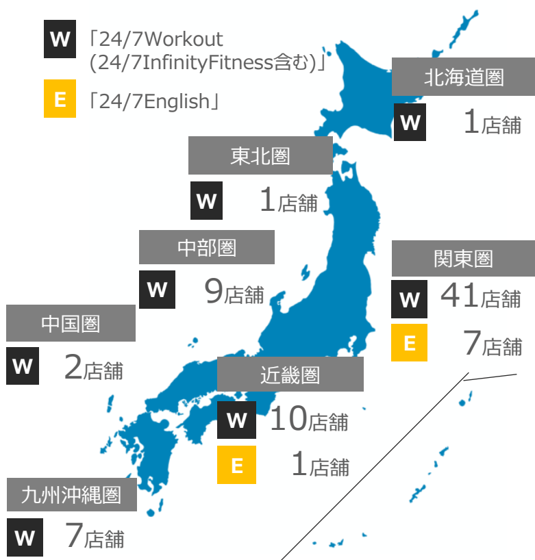
現在の地域別国内店舗網