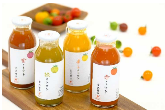
4種の色の100%トマトジュース(180ml)

また、ジュースやレトルトカレーなどの数種類の商品を同包した各種ギフトセットのラインナップも増やしました。