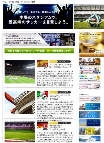
6月『サッカーヨーロッパリーグ観戦』