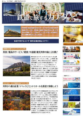
7月『鉄道で旅するカナダ』