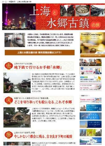
8月『上海と水郷古鎮の旅』

一方、「トラベルコンシェルジュ」の登録数も順調に推移しており、コンシェルジュが旅行以外の特技を生かせる場としてクラウドソーシング事業を展開し、優秀な人材確保に努めております。具体的には、グロリアツアーズの旅行業務のサポートおよび株式会社フィスコの情報配信業務や株式会社フィスコIRのIRニュースのショートコメントの作成及びインバウンド専用ページでの翻訳業務などで、コンシェルジュの特技を生かした様々な業務の委託は、帰属意識を高める施策として今後も取り組んでまいります。