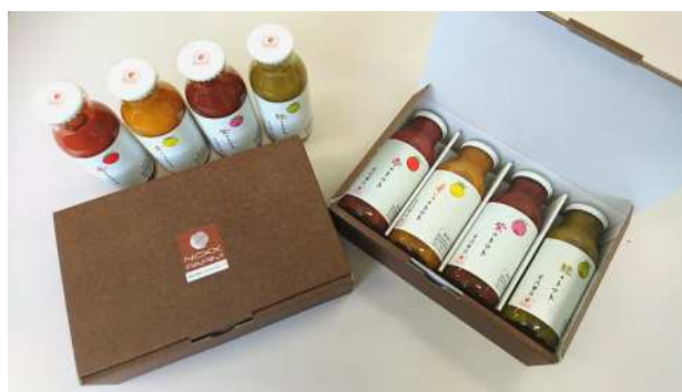
4種の色の100%トマトジュース ギフトセット

「フランチャイズ事業」では、自社圃場におきまして定期的にフランチャイズ事業の説明会を開催し、地方自治体や各種農業関連の団体などから研修の一環として活用していただくなどの対応を継続しております。また、テレビ岩手、岩手めんこいテレビなどのメディアへの露出の反響もあり、問い合わせも増加しております。