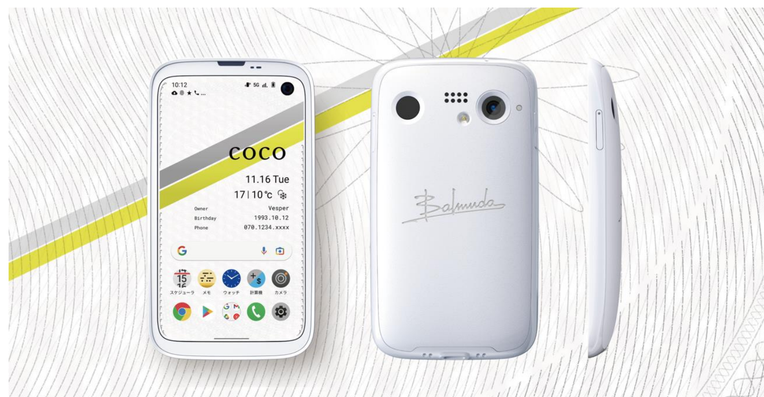
新製品 BALMUDA Phone