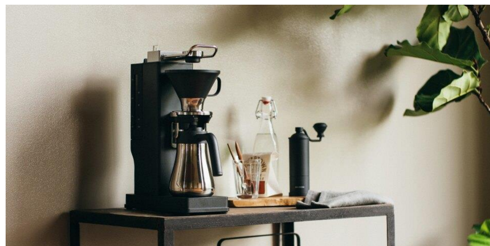
新製品 BALMUDA The Brew