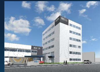
本社・東郷事業所