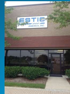
ESTIC AMERICA Inc