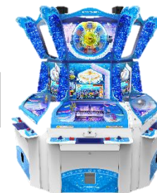
『海物語ラッキーマリントアーズ』