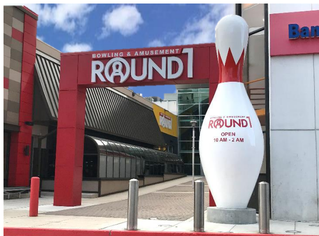
ラウンドワン タウソントンセンター店 米国 メリーランド州タウソン 2019年12月7日オープン！