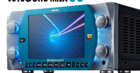
『JOYSOUND MAX GO』©エクシング