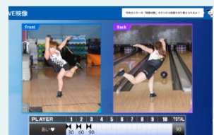
投球フォーム専用画面