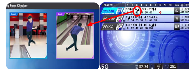
ボウリングフォームチェッカーイメージ

・『ROUND1 LIVE』導入により、前方、後方からの投球の様子が撮影可能となり、3月より、スコアモニターにて各フレームをタッチすると、そのフレームの投球をリプレイする機能を搭載。