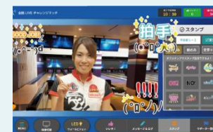
プロhestamp、メッセージの送信

『全国LIVEチャレンジマッチ』機能にて、全国のラウンドワンから人気女子プロボウラーにリアルタイムで挑戦できるプロチャレ企画が8月より随時開始。