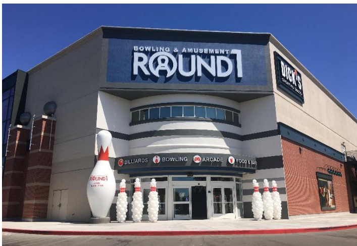
ラウンドワン サウスランド店 米国 カリフォルニア州ヘイワード 2019年7月27日オープン!