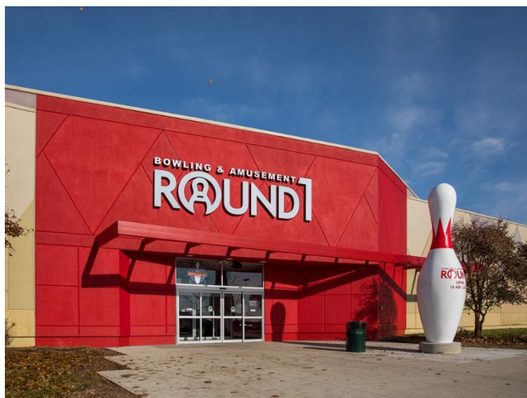
ラウンドワン グレイトレイクスクロッシング店 米国ミシガン州 2017年10月21日オープン！