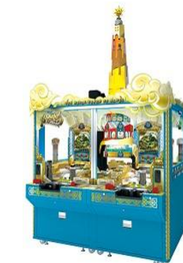
『バベルのメダルタワー cSEGA』