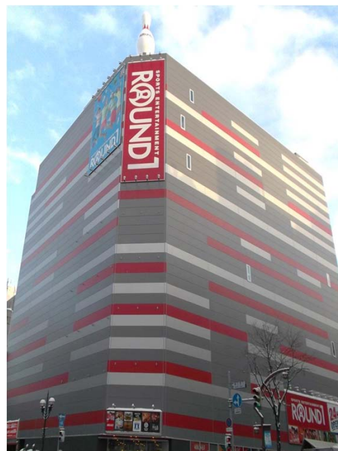
ラウンドワン 札幌すすきの店 北海道札幌市 2015年12月4日 オープン!