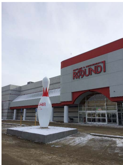
ラウンドワン タウン・シルバーシティ店 米国マサチューセッツ州タウン 2015年12月26日 オープン!