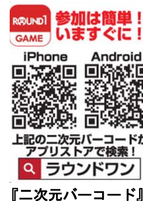
『二次元バーコード』