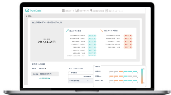
↑ 画面イメージ(表示データはサンプル)