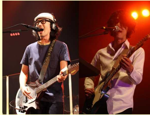
◆Ticket PIA 30th Anniversary 「MUSIC COMPLEX 2014,winter」 http://ticket-news.pia.jp/pia/news.do?newsCd=201412180009