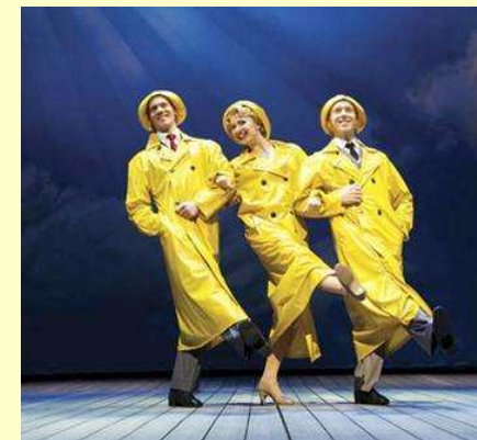
◆ミュージカル 「SINGIN' IN THE RAIN - 雨に唄えば -」 http://t.pia.jp/feature/stage/sitr/