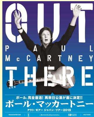
◆ポール・マッカートニー 「アウト・ゼア ジャパン・ツアー2015」 http://t.pia.jp/feature/music/paulmccartney/ (開催は4月)