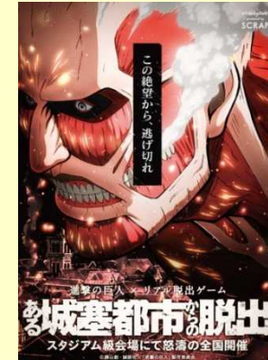
◆進撃の巨人×リアル脱出ゲーム ある城塞都市からの脱出 http://realgame.jp/shingeki/ (中部、仙台、札幌会場が主催、 福岡会場はチケットぴあ九州として主催参画)