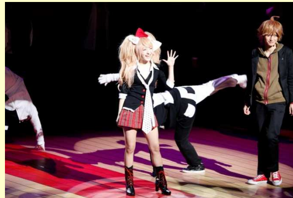
◆「ダンガンロンパ THE STAGE」 希望の学園と絶望の高校生 http://www.cornflakes.jp/dangan/ (2015年度、続編開催決定)