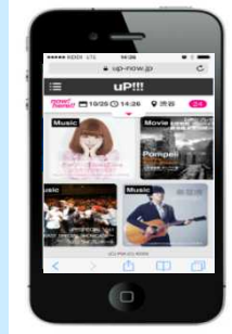
エンタテインメントサイト「uP!!!」