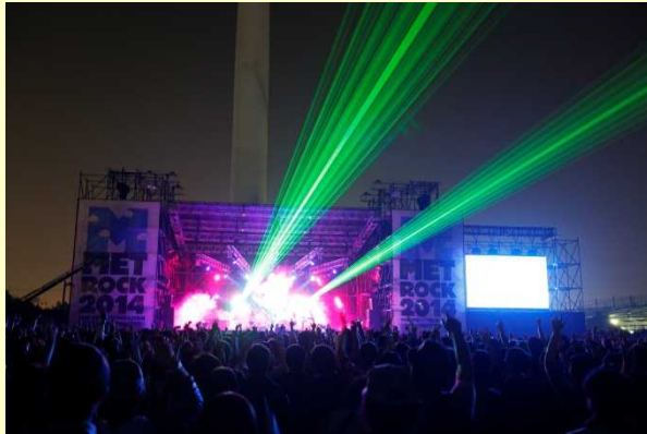
◆TOKYO METROPOLITAN ROCK FESTIVAL 2014 http://metro.rock.jp/