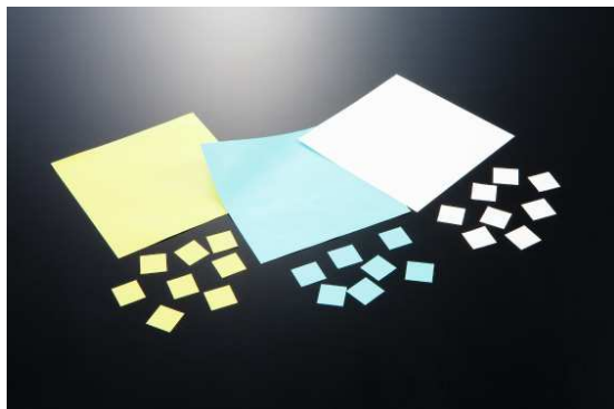
<デンカ放熱シート>