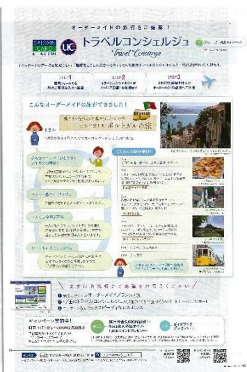
※セゾンカードが毎月発行する冊子へのコンシェルジュ機能説明