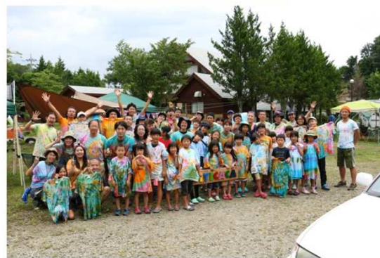
2017年9月1日発行 織研新聞第1面掲載