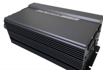
大型インバーター