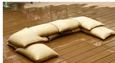
水で膨らむ吸水式土のう袋

車から家庭用家電の電源をとることができる大容量インバーター、 備蓄収納に困らない吸水式土のう袋等を発売。