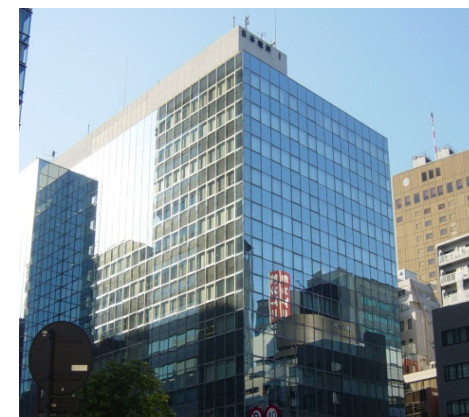
テリロジー東京本社

IS 97125 / ISO27001 EMS 513188 / ISO14001