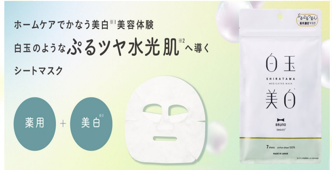
薬用 白玉美白シートマスク ¥990 《2024年12月発売》