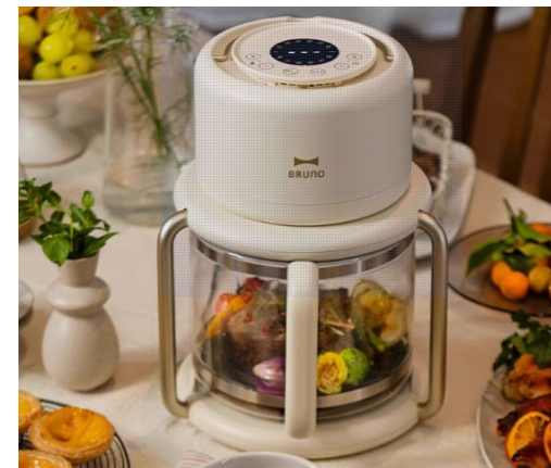
ガラスエアフライヤー