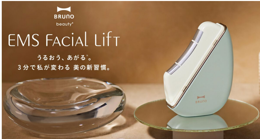
温冷EMSフェイシャルリフト ¥14,300 《2024年12月発売》

ときめきがはじまる ごきげんがつづく 明日のわたしを好きになる BRUNO beauty