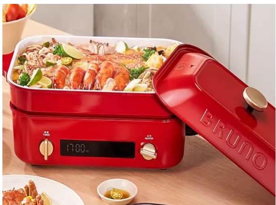
新型ホットプレート