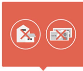
倒産や支払遅延もカバー