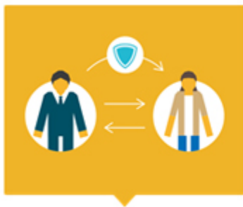
取引先には非通知