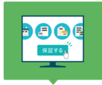
定額制で保証かけ放題