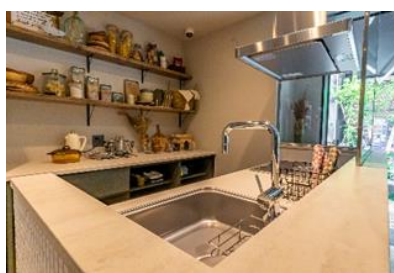
ゲスト専用キッチン