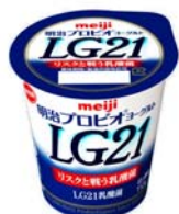
「明治プロビオヨーグルトLG21」 希望小売価格126円(税別)