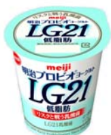
「明治プロビオヨーグルトLG21低脂肪」 希望小売価格126円(税別)