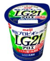
「明治プロビオヨーグルトLG21アロエ脂肪0」 希望小売価格126円(税別)