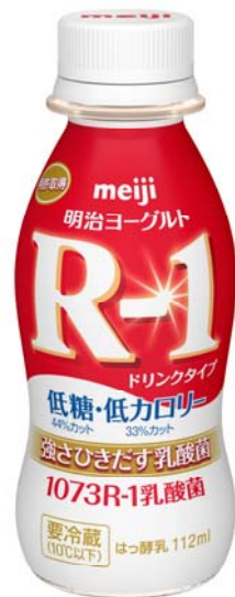
「明治ヨーグルトR-1ドリンクタイプ低糖・低カロリー」 希望小売価格126円(税別)