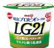
「明治プロビオヨーグルトLG21(宅配専用)」