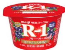
「明治ヨーグルトR-1ブルーベリー脂肪0」 希望小売価格126円(税別)