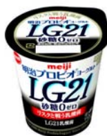
「明治プロビオヨーグルトLG21砂糖0」 希望小売価格126円(税別)