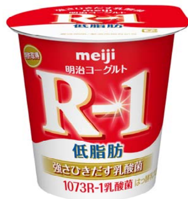
「明治ヨーグルトR-1低脂肪」 希望小売価格126円(税別)