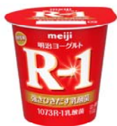
「明治ヨーグルトR-1」 希望小売価格126円(税別)