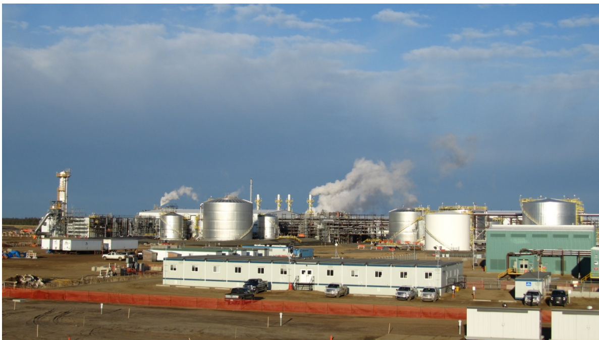
(写真 1: 水蒸気圧入開始時の中央処理施設のようす)

*5：拡張開発事業プラントにおける水蒸気圧入開始時のようす（現地時間 2017 年 4 月 28 日）