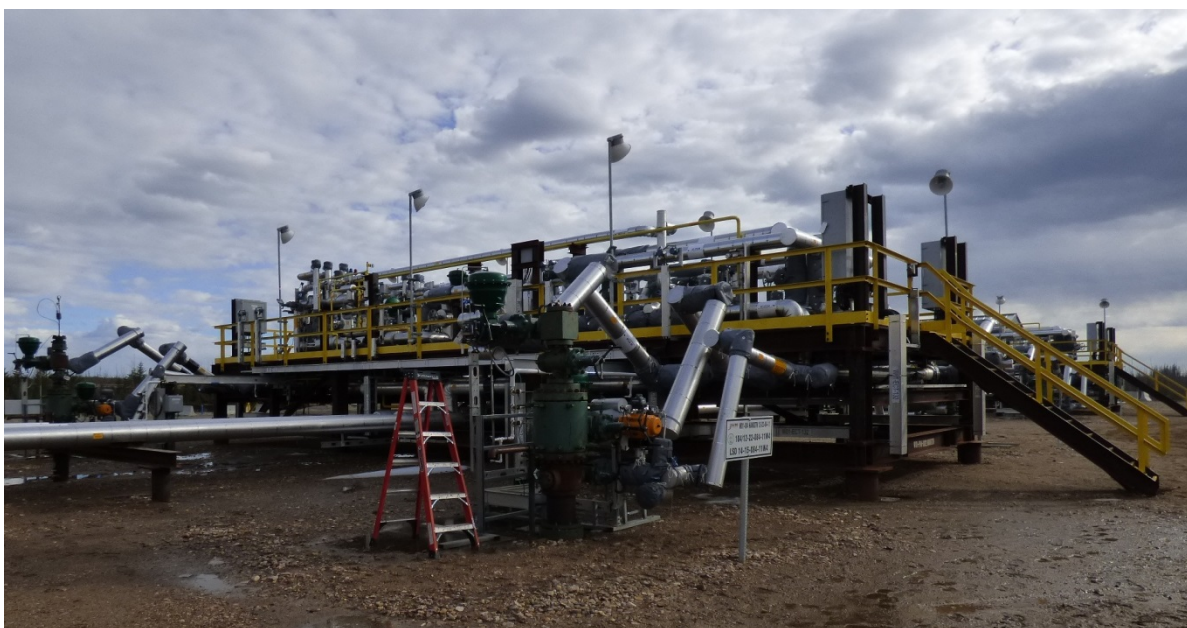
(写真 2: 水蒸気を圧入する水平井坑口周りの設備)